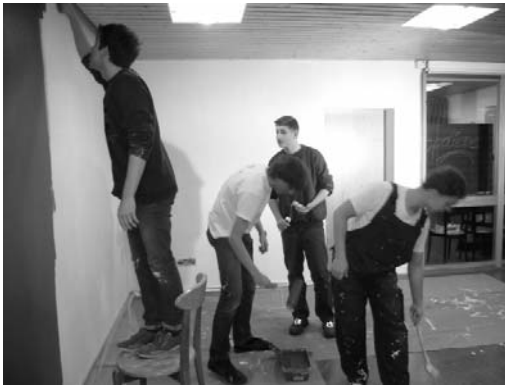
'Mal' was anderes... ...frischer Anstrich in der Jugendetage