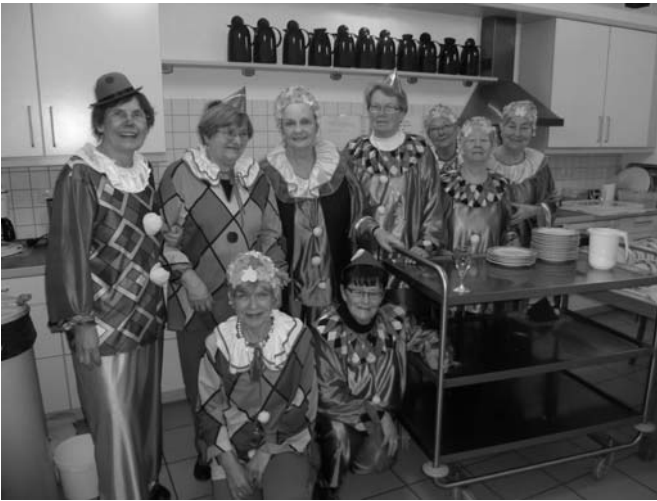
Einsatzteam des Seniorenkarneval... mit Mottowagen ;-) )