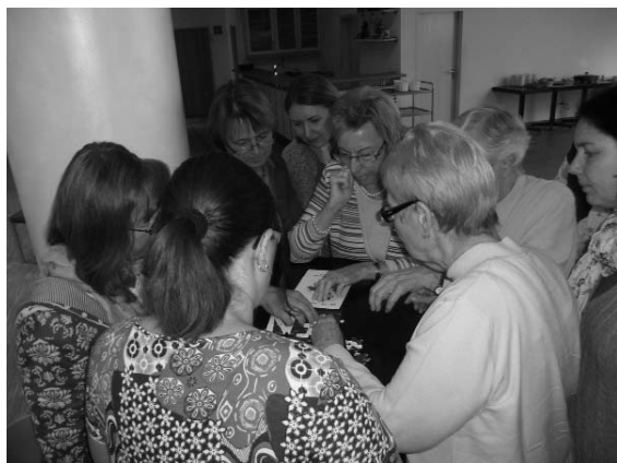
...gemeinsame Herausforderungen beim Brunchgottesdienst