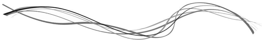
Illustration: Christian Habicht | Text: Jürgen Werth | © gott.net

Alle Menschen sind klug: ... die einen vorher und die anderen nachher!