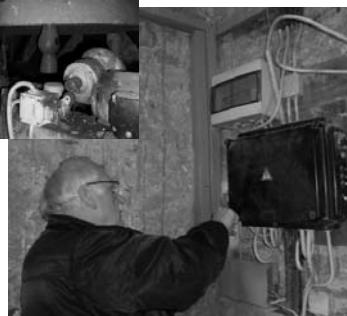
... im Glockenturm