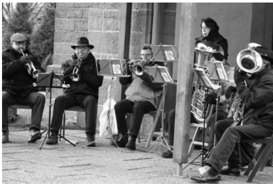
Konzert a.d. Friedhof zum Ewigkeitssonntag