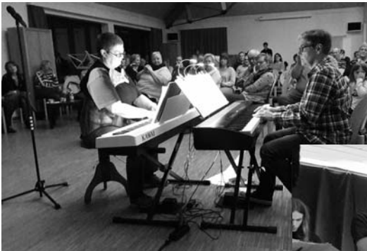
3. Rüdingerhauser Musiksession