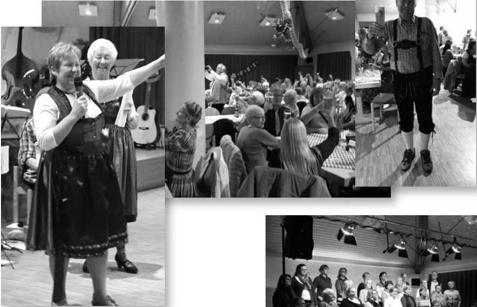
1. Rüdingerhauser Oktoberfest im Gemeindehaus