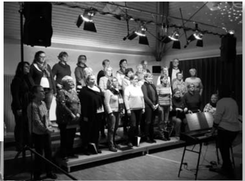
Chorkonzert von Masithi und Vocanta