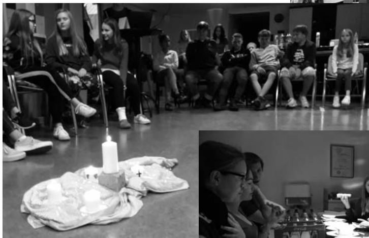
...Jugendgottesdienst zum Thema "Cyberkriminalität - Angriff auf mein Leben."