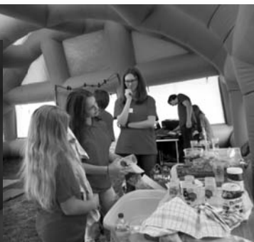
...Weltkindertag auf der Ruhrstraße