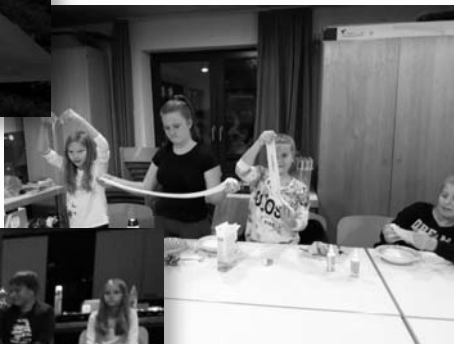
...Sehr viel selbstgebastelter Schleim