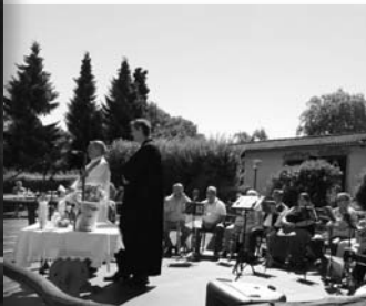
...Unser Posaunenchor spielt beim Alm Gottesdienst